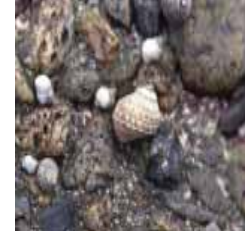
アラレタマキビガイ (小さい方)