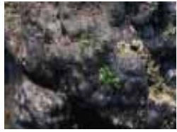
クロイソカイメン