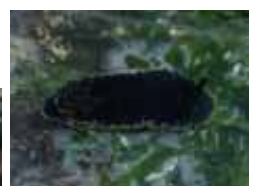
クロシタナシウミウシ