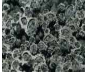
イワフジツボ 小さくて細かいもの