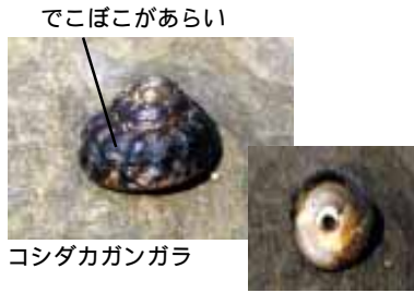
コシダカガンガラ