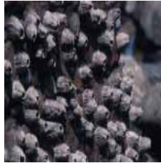
クロイワフジツボ