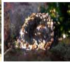
ヨロイイソギンチャク