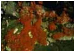
ダイダイイソカイメン