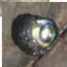
ふたが厚くて、レンズのよう