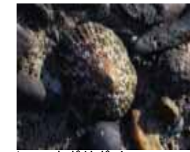
ベッコウガサガイ

キクノハナガイとカラマツガイは、有肺類といって、カタツムリと同じ仲間、肺で呼吸します。