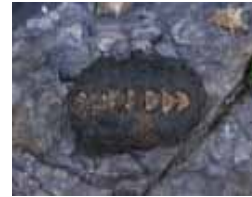
ケハダヒザラガイ