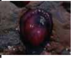
ウメボシイソギンチャク